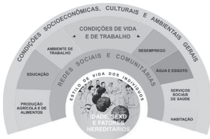
Figura 1 - Determinantes sociais: modelo de Dahlgren e Whitehead

A camada seguinte destaca a influência das redes comunitárias e de apoio, cuja maior ou menor riqueza expressa o nível de coesão social que, como vimos, é de fundamental importância para a saúde da sociedade como um todo. No próximo nível estão representados os fatores relacionados a condições de vida e de trabalho, disponibilidade de alimentos e acesso a ambientes e serviços essenciais, como saúde e educação, indicando que as pessoas em desvantagem social correm um risco diferenciado, criado por condições habitacionais mais humildes, exposição a condições mais perigosas ou estressantes de trabalho e acesso menor aos serviços. Finalmente, no último nível estão situados os macrodeterminantes relacionados às condições econômicas, culturais e ambientais da sociedade e que possuem grande influência sobre as demais camadas.